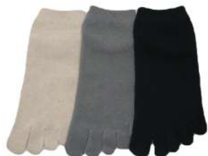
SO1143M Linenn 混 5本指ソックス ¥1188(税抜き¥1080) Size M 1.Natural 2.Gray 3.Black Cotton 92% Polyester 7% Polyurethan 1% リネン混コットンを使用した肌触りの良い 五本指ソックスです。厚み中 綿麻混