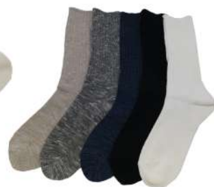
SO1129M リネン混2×2リブソックス ¥1166(税抜き¥1060) Size M 1.Beige 2.Gray 3.Navy 4.Black 5.White Cotton 71% Acrylic 13% Linen 8% Polyester 7% Polyurethan 1% 0051より短めの綿麻リブソックスです。 厚み中 綿麻