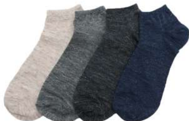
SO1150M リネンスニーカーソックス ¥968(税抜き¥880) Size S 1.Natural 2.CGray 3.MBlack 4.Navy Linen 79% Polyester 16% Polyurethan 5% ざらりとした質感の定番リネン ソックスです。厚み小麻