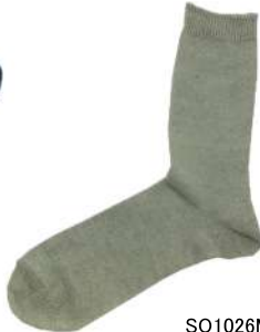
SO1026M リネンソックス ¥1298(税抜き¥1180) Size M 4.Linen 6.Navy 9.MGray 13.MBlack 19 SBlack Linen 90% Polyester 8% Polyurethan 2% ざらりとした質感の定番リネン ソックスです。厚み小麻