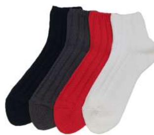
SO1127M Eco コットンリブソックス ¥1056(税抜き¥960) Size M 1.Navy 2.Gray 3.Red 4.White Cotton 92% Polyester 7% Polyurethan 1% 100%リサイクルコットンを使用した ざっくりしたリブソックスです。 厚み太 綿