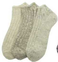
COS0050M 綿麻スニーカーソックス ¥1056(税抜き¥960) Size M 1.Natural 3.Mix Cotton 63% Linen 27% Polyester7% Polyurethan 3% 2.Beige Cotton 70% Linen 12% Polyester 9% Acrylic 8% Polyurethan 1%