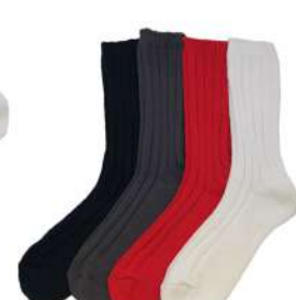
SO1126M Eco コットンリブソックス ¥1078(税抜き¥980) Size M 1.Navy 2.Gray 3.Red 4.White Cotton 92% Polyester 7% Polyurethan 1% 100%リサイクルコットンを使用した ざっくりしたリブソックスです。 厚み太 綿