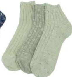
COS0073M 綿麻クルーソックス ¥1078(税抜き¥980) Size M 1.Natural 3.Mix Cotton 63% Linen 27% Polyester7% Polyurethan 3% 2.Beige Cotton 70% Linen 12% Polyester 9% Acrylic 8% Polyurethan 1%