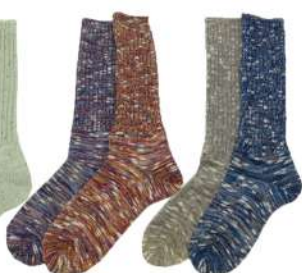
COS0051M 2×2 リブソックス 4.Purple 11.Rainbow Cotton 55% Acrylic 35% Polyester7% Polyurethan 3% 定番の細リブソックスです。 基本の1足。厚み中