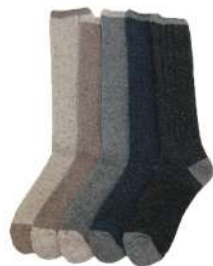
COS0060M 三面切替ソックス ¥1628(税抜き¥1480) Size S 1.Natural 2.Beige 3.Gray 4.Navy 5.CGray Acrylic 36% Polyester32% Cotton 27% Polyurethan 5% 秋冬の定番綿アクリルのあったか ソックスです。厚み大 綿アク混