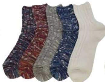
COS0073M コットンクルーソックス ¥1078(税抜き¥980) Size M 5.Purple 6.Rainbow 7.Oatmeal 8.Navy 9.White Cotton 55% Acrylic 35% Polyester7% Polyurethan 3% 定番の麻混クルーソックスです。 くるぶし上の丈。厚み中