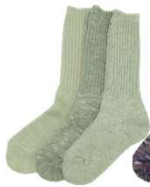
COS0051M 2×2 綿麻リブソックス ¥1166(税抜き¥1060) Size M 1.Natural 3.Mix Cotton 63% Linen 27% Polyester7% Polyurethan 3% 2.Beige Cotton 70% Linen 12% Polyester 9% Acrylic 8% Polyurethan 1%