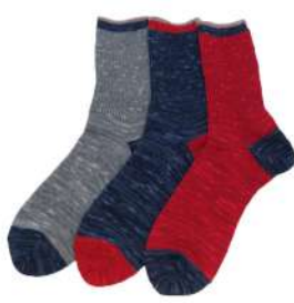
SO1118M コットンクルーソックス ¥1056(税抜き¥960) Size M 1.Gray 2.Blue 3.Red Cotton 72% Acrylic 18% Polyester 9% Polyurethan 1% 締め付けの優しいソックスです。 厚み中 綿混