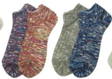
COS0050M コットンスニーカーソックス ¥1056(税抜き¥960) Size M 5.Purple 6.Rainbow 7.Oatmeal 8.Navy Cotton 55% Acrylic 35% Polyester7% Polyurethan 3% 定番綿混スニーカーソックスです。 くるぶし下位です。厚み中